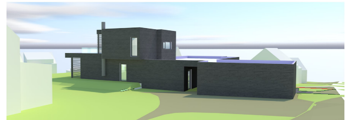
3D SKISSE sett fra nordøst