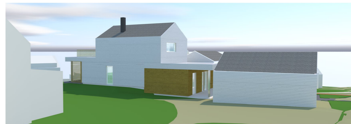
3D SKISSE sett fra nordøst