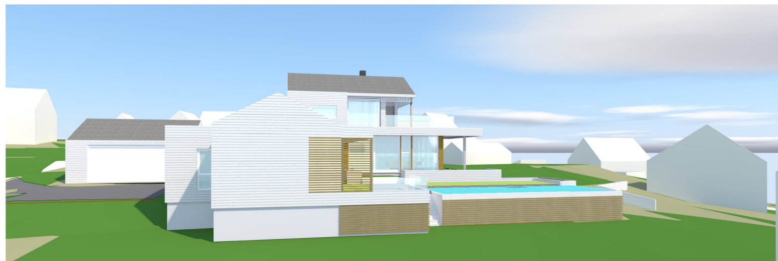
3D SKISSE sett fra vest