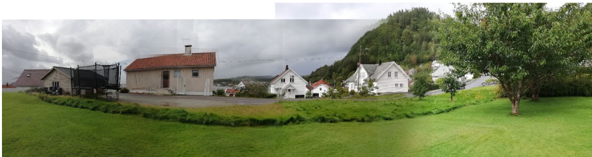
Utsikten fra terrassetrappa hos Nessavegen 3 i dag.